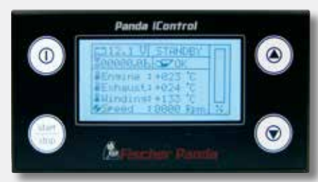
Panda iControl Panel